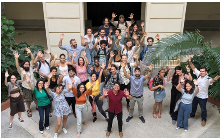
Group picture of the "Hands-On Quantitative Biology School" (Havana, Cuba, 4-15 nov. 2024).

On a summer night in the 1930s, physicist Max Delbrück and biologist Salvatore Luria were enjoying a cold beer in Rome. Luria explained to Delbrück the most controversial debate of the time in evolutionary biology: Are mutations spontaneous—as theorized by Darwin—or do they occur in response to stress? Delbrück became interested in the question, and the two designed an ingeniously simple experiment to test whether mutations occurred spontaneously or not. The experiment was finally performed in 1943. Darwin was right, and the two received the Nobel Prize in 1969 for that work. This remarkable result came from the collaboration between a biologist and a physicist.