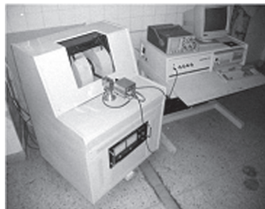
Figura 1. Vista general del relaxómetro de Resonancia Magnética cubano Giromag.

problemas biomédicos de impacto que pudieran abordarse con RM. c) Estudiar las vías concretas para calcular, diseñar y construir un equipo de RMI para estudios de cuerpo completo en humanos. En esencia estas tres tareas de la primera etapa fueron cumplidas a los 7 meses en julio del 1988.