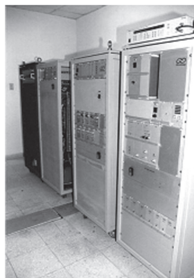
Figura 3. Vista general de los bloques electrónicos diseñados y construidos para los equipos de Imágenes de Resonancia Magnética cubanos Girolmag